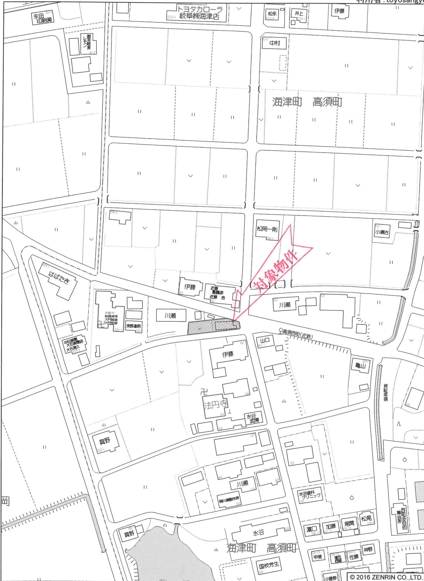
海津市海津町 高須町付近